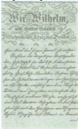
Охранная грамота Вильгельма II на германские колонии в Восточной Африке