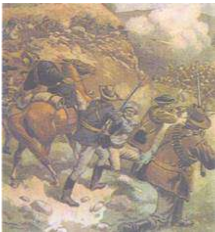
Стрелки бурской армии атакуют позиции англичан. Какой характер приобрела борьба буров с англичанами?