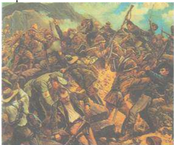
Сражение английских и бурских войск за столицу Трансвааля — Преторию. 1900 г.

Колониальные захваты Франции. Второй колониальной державой мира стала Франция. Восстановив свою мощь после поражения во франко-прусской войне, уже в 1880-е гг. Франция активизировала колониальную политику. В 1881 г. она устремилась в Азию. Закрепившись в Центральном Вьетнаме, который стал базой для дальнейших захватов, она расширила свои владения на весь Индокитай (ныне Вьетнам, Лаос, Камбоджа). Китай не смог защитить свои вассальные территории. Затем власть Франции признали племена Сахары, народы Западной и Экваториальной Африки. В 1894—1896 гг. был покорен Мадагаскар.