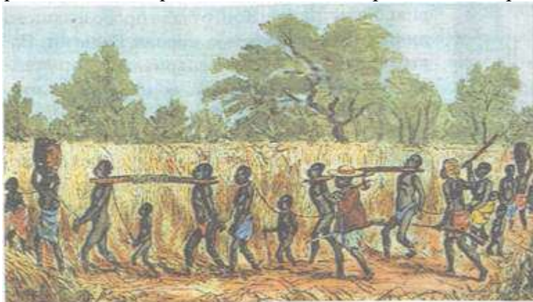
Караван рабов в Экваториальной Африке. 1870 г.

Германия как колониальная держава. После победоносной войны с Францией на путь колониальных захватов вступила Германия. В 1885 г. была учреждена Германская восточноафриканская компания. Ей удалось закрепиться в прибрежной полосе протяженностью 1800 км, где была создана колония Восточная Африка. Германия также захватила часть Юго-Западной Африки, Того и Камерун. В бассейне Тихого океана она оккупировала часть острова Новая Гвинея и прилегающие архипелаги.